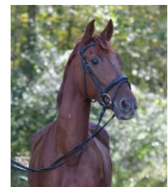
foto volgt Ik ben Dorus en ik ben een grote gezellige lieverd. Op stal ben ik rustig en straal ik mijn rust ook uit. Met rijden maak ik grote passen, en heb ik altijd zin om voor je te werken.

Ik ben Sangria en ik ben een voorwaartse pony die in alles heel goed mijn best wil doen voor jou. Met opstappen vind ik het fijn als je even wacht tot er hulp is, dan blijf ik netjes staan en is het opstappen voor mij ook goed zo. Met opzadelen ben ik heel lief, alleen voetjes geven kan ik soms een beetje vervelend vinden.